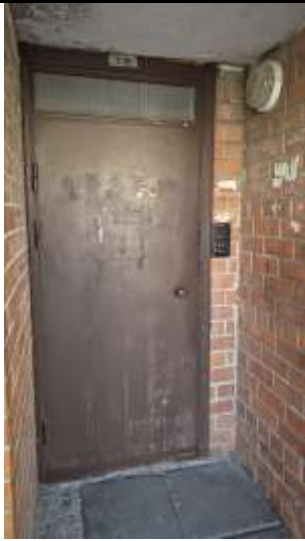
Kāpņu telpas ārdurvis